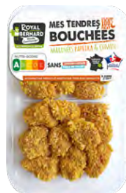
MES TENDRES BOUCHÉES MARINÉES PAPRIKA & CUMIN 100% filet

EAN13 : 3276280086356 GENCOD : - / CODE : 12502