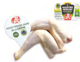
CUISSES DE POULET FERMIER JAUNE de la Drôme Label rouge

EAN13 : 3276280087186 GENCOD : 2208718 / CODE : 21460