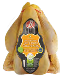
POULET FERMIER JAUNE Trois Châteaux de la Drôme Label Rouge