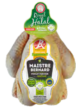
POULET ENTIER JAUNE de la Drôme « Maistre Bernard » Halal Label Rouge

EAN13 : 3276280905121 GENCOD : 2490512 / CODE : 1551