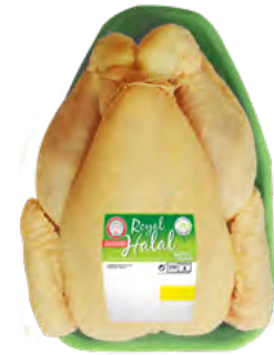
POULET ENTIER PAC HALAL

EAN13 : 3276280752039 GENCOD : 0275203 / CODE : 1054