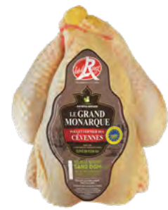
POULET FERMIER JAUNE Grand Monarque des Cévennes Label Rouge