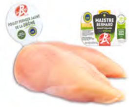
FILETS DE POULET FERMIER JAUNE de la Drôme Label Rouge