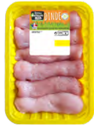
ESCALOPE DE DINDE 720G

EAN13 : 3276280088824 GENCOD : - / CODE : 26020