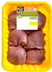
SAUTÉ DE DINDE 500G

EAN13 : 3276280088831 GENCOD : - / CODE : 26025