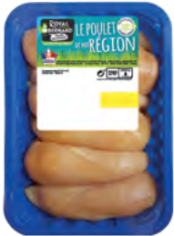
720G DE FILETS DE POULET

EAN13 : 3276280084680 GENCOD : - / CODE : 26022