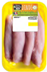
ESCALOPE DE DINDE 500G

EAN13 : 3276280088831 GENCOD : - / CODE : 26025