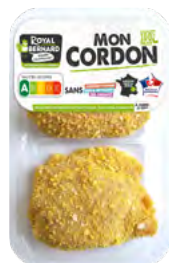
MON CORDON X2 Cordon bleu de dinde

EAN13 : 3276280086356 GENCOD : - / CODE : 12502