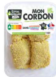
MON CORDON X4 Cordon bleu de dinde

SANS CONSERVATEUR HUILE DE PALME SEL NITRITÉ