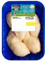
1KG DE CUISSÉS DE POULET

EAN13 : 3276280085793 GENCOD : - / CODE : 10062