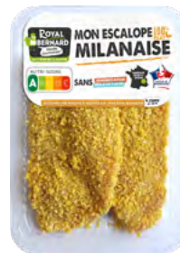
MON ESCALOPE MILANAISE Escalope de dinde à la milanaise

EAN13 : 3276280086332 GENCOD : 2208633 / CODE : 12505